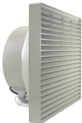
LS 3 K