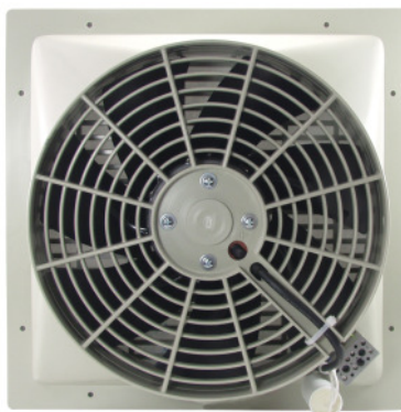
LS 3 (K)