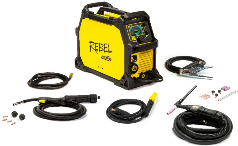
Rebel EMP 205ic AC/DC и аксесоари