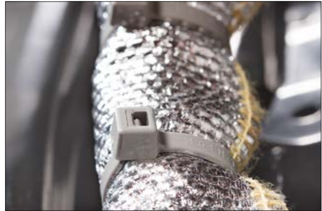
PA46 Kabelbinder eignen sich ideal für höhere Betriebstemperaturen bis +150 °C (PA46).