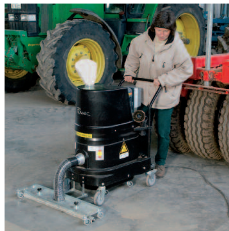
DS 1150 Staub-Ex mit Bodenabsaug- vorrichtung in der Agrarindustrie