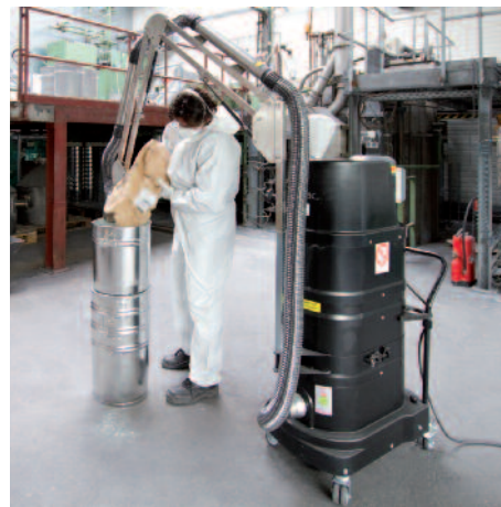
DS 1750 Staub-Ex, mit Absaugarm in der Kunststoff- produktion