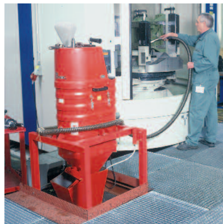
DS 1220 als Silosauger in der Metallproduktion